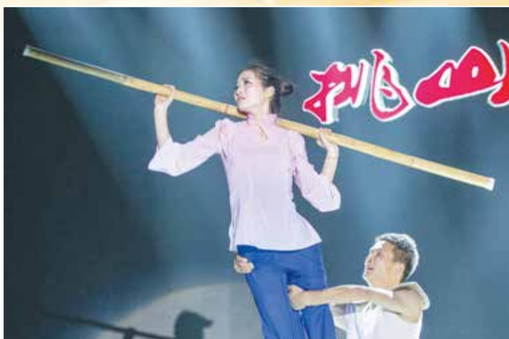
特邀节目 市演艺公司舞蹈《挑山》