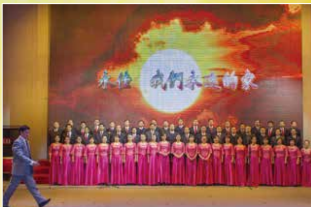
最佳组织奖 大合唱《永佳，我们永远的家》