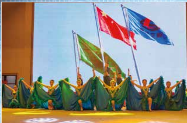
最佳表演奖 三利舞蹈《时代步伐》