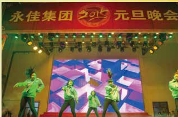
参与奖 华惠街舞《活力华惠》