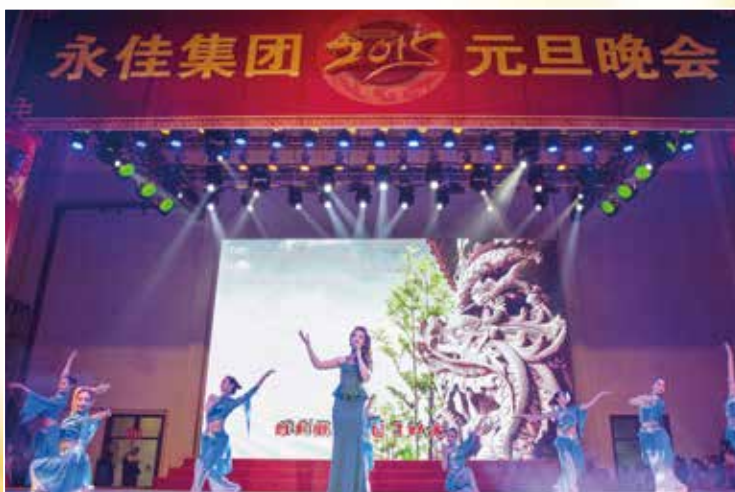
特邀节目 市演艺公司歌伴舞 《雕刻徽州》